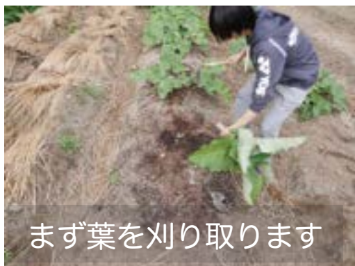
まず葉を刈り取ります