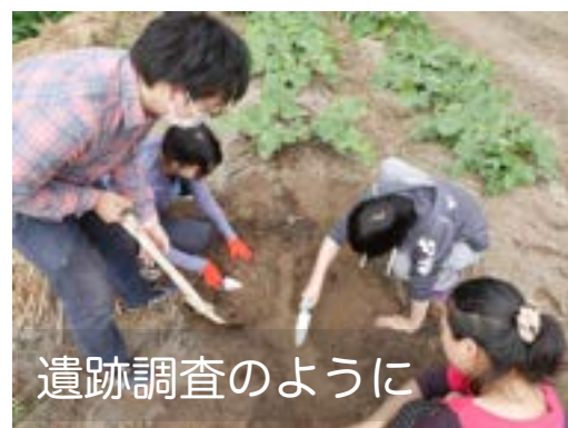
遺跡調査のように