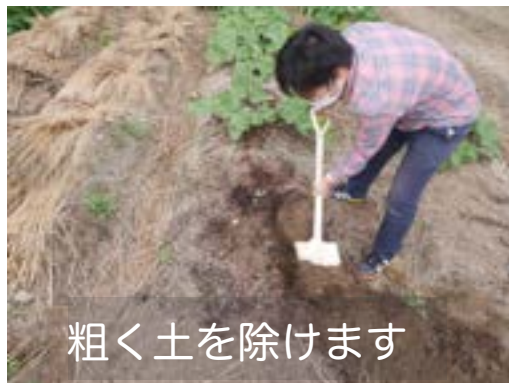
粗く土を除けます